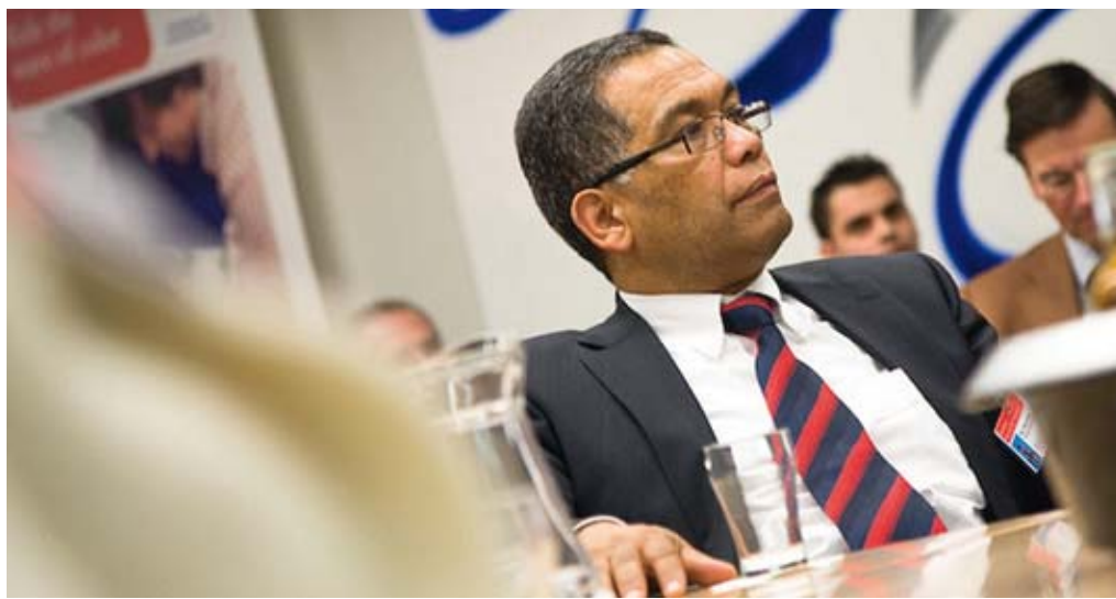
Gedeputeerde Essed van de provincie Noord-Brabant