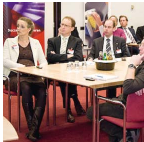
Bijeenkomst 'Ben er morgen nog' bij Océ te Venlo

Klostermann om vervolgens in Schijndel bij Mewa Plastics te arriveren. Waarna we in Epen, Limburg belanden bij het Appartementenhotel Ons Epen en doorreisden naar Vorstermans Installatietechniek in Meijel om vervolgens te eindigen bij het nabijgelegen Océ in Venlo. Stuk voor stuk innovatieve bedrijven die economisch sterker zijn met duurzaamheid. Een verslag van deze reis kunt u teruglezen op www.syntens.nl/benermorgennog . Dit boek is geschreven voor ondernemers die er ook morgen nog willen zijn. Bedrijven laten hierin zien dat een nieuw evenwicht tussen 'people', 'planet' en 'profit' wel degelijk meer van alles kan zijn.