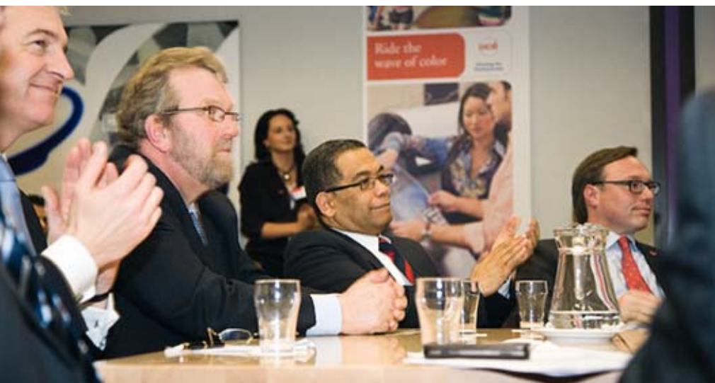
Bijeenkomst 'Ben er morgen nog' bij Océ te Venlo

Syntens, Innovatienetwerk voor ondernemers, ondersteunt ondernemers in het Midden- en Kleinbedrijf (MKB) bij innovatie in de brede zin van het woord. Door vernieuwing en verbetering verhogen deze bedrijven immers hun rendement en daarmee hun concurrentiepositie. Met deze doelstelling financiert het Ministerie van Economische Zaken de activiteiten van Syntens. Het gaat daarbij om kennis op technologisch, commercieel, organisatorisch en bedrijfsmatig gebied. De adviseurs van Syntens werken onafhankelijk en koppelen -via hun uitgebreide kennisnetwerk van bedrijven en instellingen- de ondernemer aan de juiste (markt)partijen. Syntens heeft 15 vestigingen, in Brabant zijn er vestigingen in Eindhoven en Breda.